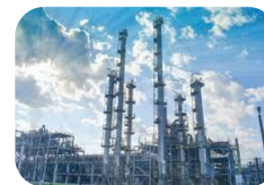
Заводы/производства и т.д.